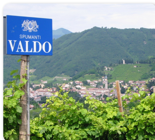
ITALY'S TOTAL PROSECCO MARKET Share by volume Valdo year 2008 (source: IRI Infoscans Censur)

Numerosi sono i riconoscimenti nazionali ed internazionali che ci sono stati attribuiti negli anni, ma una delle nostre più grandi soddisfazioni è sapere che la tradizione, l'esperienza e la qualità del nostro Prosecco possa essere apprezzata anche nei paesi a noi più lontani, dalle più differenti tradizioni e stili di vita, uniti da un unico filo conduttore dal nome Valdo Spumanti.